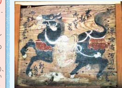
永平寺町指定文化財「蔵王権現社絵馬群」のうち 夢楽洞司の県内確認最古の絵馬

令和8年度永平寺町文化財企画展「新解釈絵馬展(仮)」 7/18(土)～9/23(水・祝) (※8月7・8日は観覧不可) 上吉野区の蔵王権現社に300年前から奉納されていた絵馬群(48点)が町指定文化財になりました。現在と異なる絵馬の奉納理由もぜひ発見してください。 9時～17時(入館は閉館30分前まで) 四季の森複合施設 絵天井の間 12