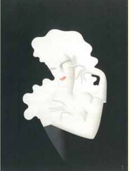
福井復興博覧会ポスター原画「網の精」(東郷青児作、福井市所蔵)

8/7(金)～9/27(日) 激動と呼ぶにふさわしい昭和の時代、その幕開けの時期から日本のかじ取りを担った岡田啓介をはじめとして、戦前・戦中・戦後・高度経済成長期に各分野で活躍したふくいゆかりの人物たちを関連資料とともに紹介。あわせて大きく変遷した人々の「そのころの暮らし」を振り返る。 9時～19時(入館は閉館30分前まで) 700円