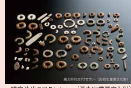
縄文時代のアクセサリー(国指定重要文化財)

夏季企画展「あわら市文化財保存活用地域計画展(仮)」 7/11(土)～8/30(日) 令和7年に文化庁から認定を受けた「あわら市文化財保存活用地域計画」の内容を紹介し、市に残るさまざまな文化財を展示します。 無料