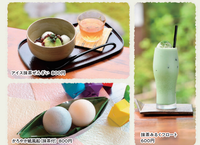
アイス抹茶ぜんざい 800円